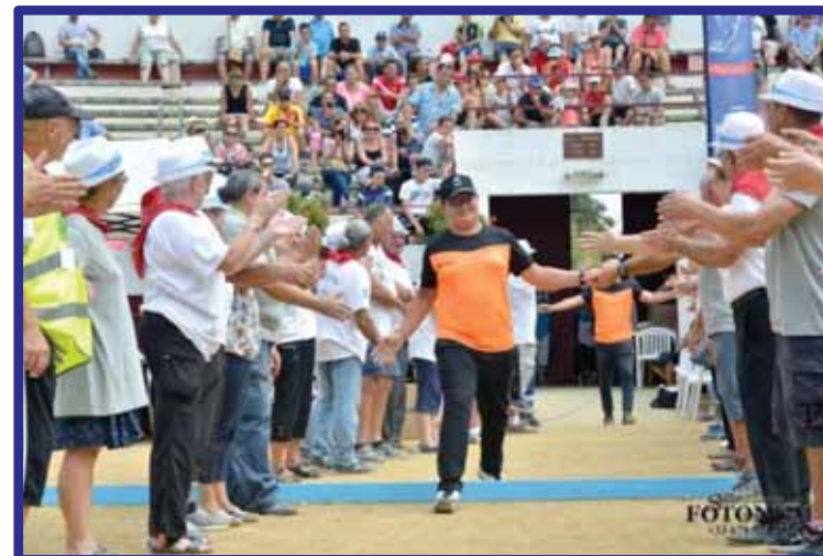
Expérience jeunes Arbitres Soustons 2017

Jeunes Arbitre FFPJP et Arbitre départemental FFPJP (à partir de 16 ans)