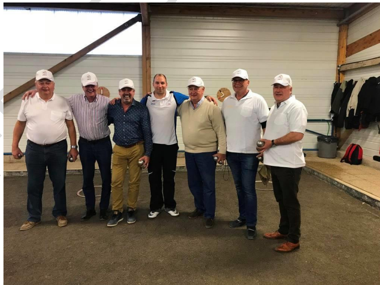
Stage d'apprentissage en présence de joueurs belges et d'un éducateur diplômé FFPJP (nov. 2017)